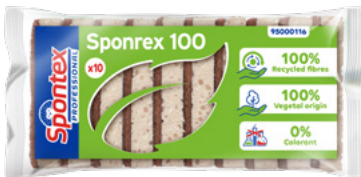
Sponrex 100 95000116