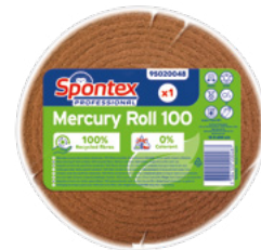
Mercury Roll 100 95020048

Composizione: Fibre sintetiche riciclate, cariche abrasive di alluminio, gusci di noce, lattice