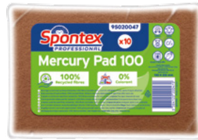
Mercury Pad 100 95020047

Composizione: Parte spugna: Plasticante, acqua, cellulosa Parte abrasiva: Fibre sintetiche riciclate, cariche abrasive di alluminio, gusci di noce, lattice, colla