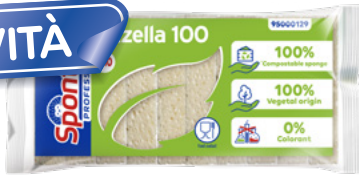
Azella 100 95000129